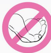
Boule trop petite