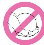
Boule trop grande